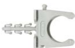
SF plus RC