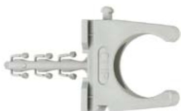
SF plus RC